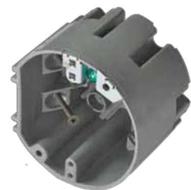
SBCRND 24 po 3