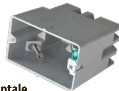
SBCHZ 22,5 po 3

Très profonde pour recevoir les ventilateurs à pales qui s'installent à l'intérieur de la boîte.