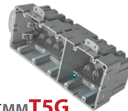
SBCMMT5G 91,5 po 3

Languettes externes amovibles fournies pour faciliter la pose dans les nouvelles installations et l'installation sur des poteaux métalliques. Le montage vertical permet une imposante installation multiple dans un espace restreint. Un diviseur (SBCMMW) fourni pour séparer les tensions.