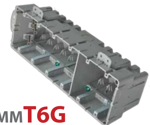
SBCMMT6G 110 po 3