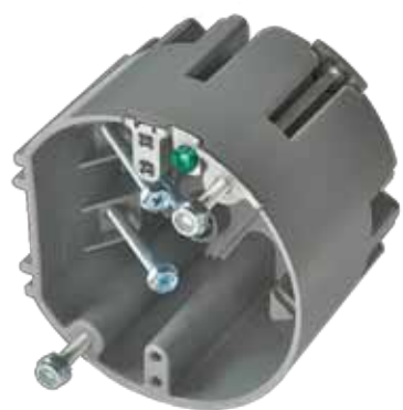
SBCFAN 24 po 3 Boîte pour ventilateur

Très profonde pour l'installation de tous les types de détecteurs de fumée ou de monoxyde de carbone.